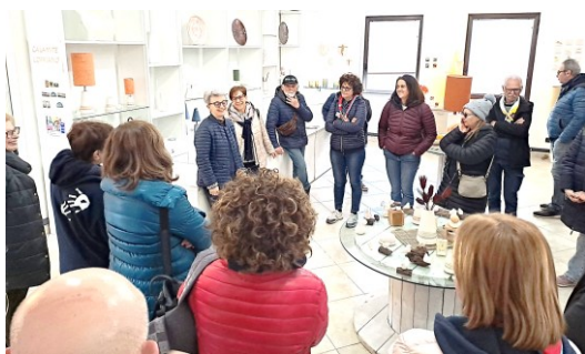
Un momento di riflessione

Il 14 e 15 marzo ci siamo recati come Millemani per gli Altri a Loppiano con il cuore aperto a conoscere e assaporare il mondo dei focolarini di Chiara Lubich. Sono stati due giorni intensi e sorprendenti nei quali i focolarini ci hanno raccontato la scelta di vita che hanno fatto accogliendo e abbracciando il Vangelo che hanno trasferito nella loro quotidianità fatta di lavoro, di studio, di servizio e di preghiera. Il loro tratto distintivo è la gioia che traspare dai loro volti e dai loro sorrisi, trasudano serenità e soddisfazione per la certezza di aver fatto la scelta giusta. Chiara Lubich era originaria del Trentino e, come tutti i trentini, era concreta, pragmatica e determinata nella sua costanza e fiducia nel prossimo. E' salita in cielo nel 2008 ma i focolarini continuano a testimoniare come si può essere "straordinari nell'ordinario" accogliendo senza pregiudizi e ascoltando l'altro con la capacità di andare oltre le proprie convinzioni e diffondendo la pace e l'unità tra tutti. Ho avuto la fortuna di conoscere un altro trentino, un sacerdote, Padre Modesto, che, proprio come Chiara, ha cercato di vivere il Vangelo in maniera concreta predicando una fede viva, aperta e gioiosa e calata in mezzo alle persone. P. Modesto non ha avuto la stessa notorietà di Chiara ma è stato bello conoscere un mondo, per certi aspetti simile al nostro, e dirci che le difficoltà si affrontano con il confronto e il dialogo e che, pur "facendo noi cose che loro