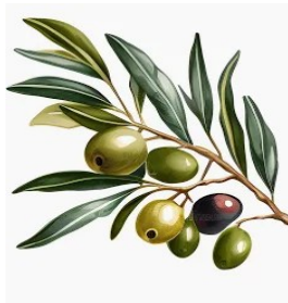
L'ulivo della Pace