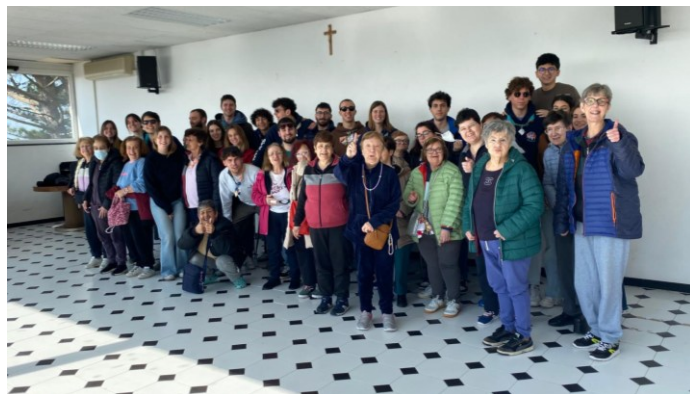
Era il 2025

Per il terzo anno consecutivo, la direzione della Madonnetta ha deciso di trascorrere sette giorni insieme all'interno del Seminario Arcivescovile di Genova. Durante la "Settimana Comunitaria" i responsabili si impegnano a vivere la quotidianità in gruppo, adeguandosi il più possibile agli orari di tutti per passare la maggior parte del tempo insieme. L'organizzazione è fondamentale per la buona riuscita di questa attività e an-