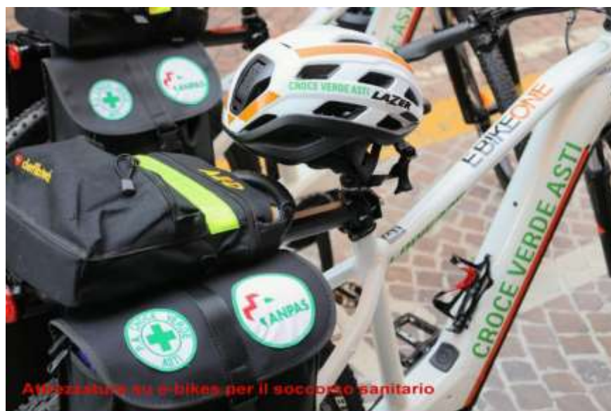
Attrezzatura su e-bikes per il soccorso sanitario

I volontari soccorritori della Croce Verde Asti sono oltre 222, di cui 73 donne, organizzati in squadre notturne e diurne che affiancano i 15 dipendenti. La Croce Verde Asti effettua oltre 16mila servizi annui. Si tratta di trasporti in emergenza urgenza 118, prestazioni convenzionate con le Aziende sanitarie locali, assistenza sanitaria a eventi e manifestazioni sportive con una percorrenza di circa 320mila chilometri.