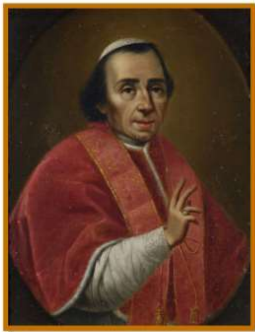
Vincenzo Camuccini "Pio VII benedicente" 1820 ca. olio su tela cm. 29x21,5

15 settembre 2023, ore 17.00, donazione di un'opera dell'artista Francesco Vichi alla quadreria delle A.P.S.P. Opere Sociali di Savona