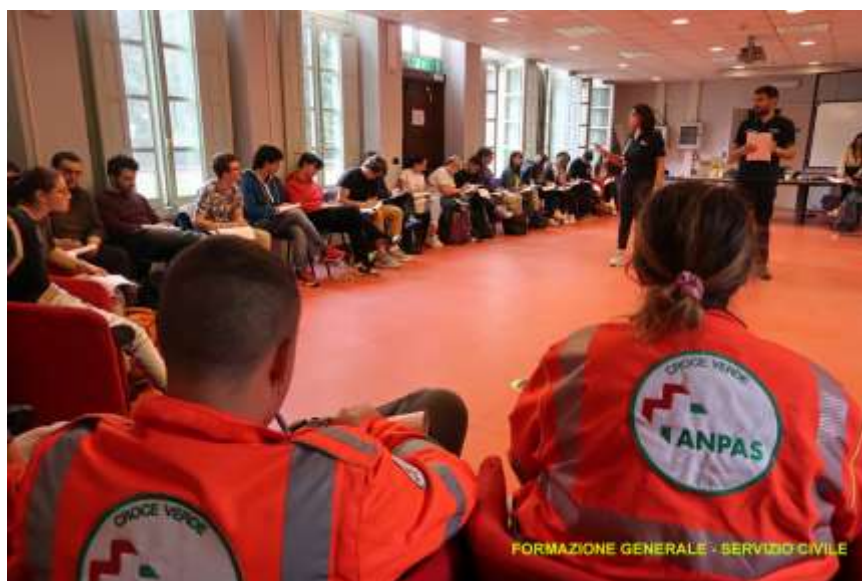
FORMAZIONE GENERALE - SERVIZIO CIVILE

I progetti di servizio civile in Pubblica Assistenza Anpas nel campo del soccorso di emergenza 118 in Piemonte includono, oltre alla possibilità di effettuare i servizi sociali precedentemente descritti, anche l'impiego in servizi di emergenza urgenza 118. I volontari in servizio civile saranno quindi impegnati nel ruolo di soccorritore in ambulanza e in tutte le mansioni riguardanti le attività di emergenza e primo soccorso.