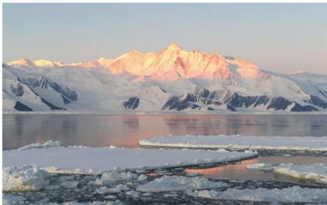
Cape Hallett, Mare di Ross (Antartide), Febbraio 2016

Ciclo di incontri in AUDITORIUM DELL'ACQUARIO e online su www.amiciacquario.ge.it