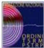
Ordine TSRM PSTRP