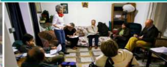
CASA FAMIGLIA (CASA DOMANI) ATTIVITA' CON PERSONE DISABILI GIUGNO - LUGLIO - SETTEMBRE