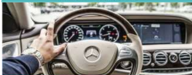
IL SOGNO DI TOMMI SERVIZIO TRASPORTO DA E PER OSPEDALE GASLINI GIUGNO-LUGLIO-AGOSTO-SETTEMBRE