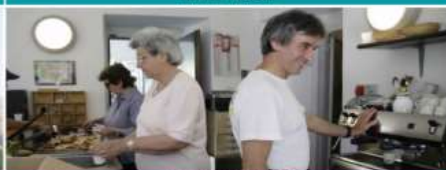
ASS. SOLELUNA ONLUS MENSA PER PERSONA IN DIFFICOLTA' GIUGNO, LUGLIO E SETTEMBRE