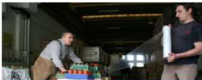
BORGO SOLIDALE MAGAZZINO LA CAMBUSA LUGLIO-AGOSTO-SETTEMBRE