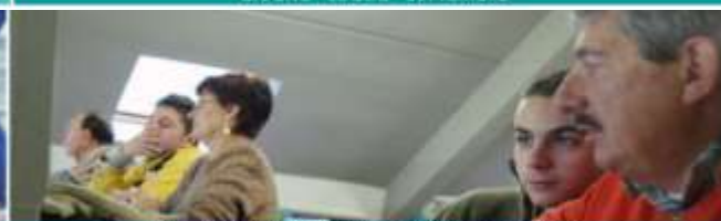
FEDERAZIONE REGIONALE SOLIDARIETA' E LAVORO CENTRO SERVIZI PER IMMIGRATI LUGLIO - AGOSTO