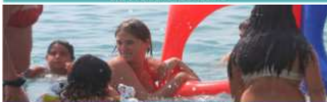
CENTRO SAS PEGLIESE E ASD SAN MARZIANO CENTRO ESTIVO MINORI DAL 10 GIUGNO AL 6 AGOSTO