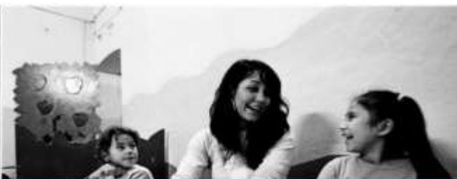
ASS. IL CESTO ODV CENTRO ESTIVO MINORI DAL 14 GIUGNO AL 30 LUGLIO