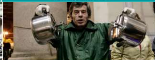
VOLONTARI PER L'AUXILIUM SERVIZIO MENSA PER SENZA DIMORA DA GIUGNO A SETTEMBRE