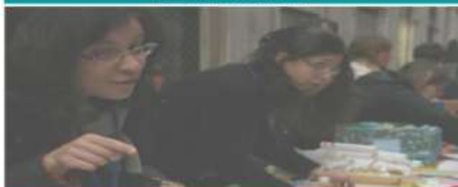
ASS. LA STAFFETTA CENTRO ESTIVO MINORI DAL 14 GIUGNO AL 6 AGOSTO