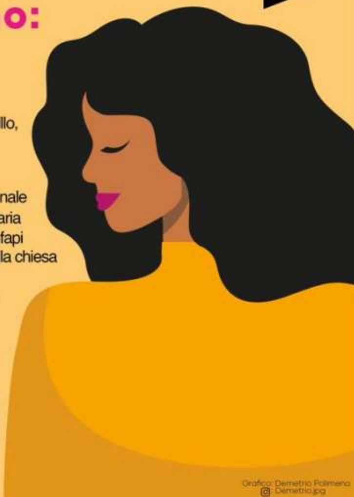
Grafico: Demetrio Polimeno @ Demetrio.pg