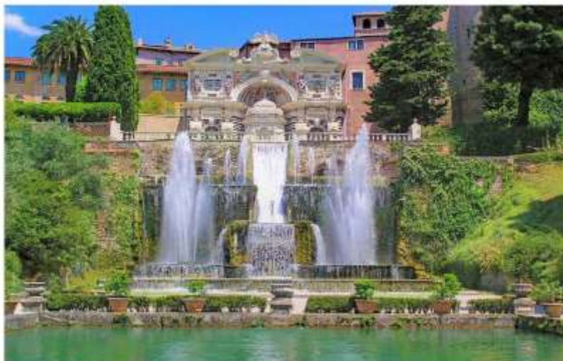
Organo rinato di Villa Tivoli, https://tabletroma.it/villa-delle-gioie-del-barocco/