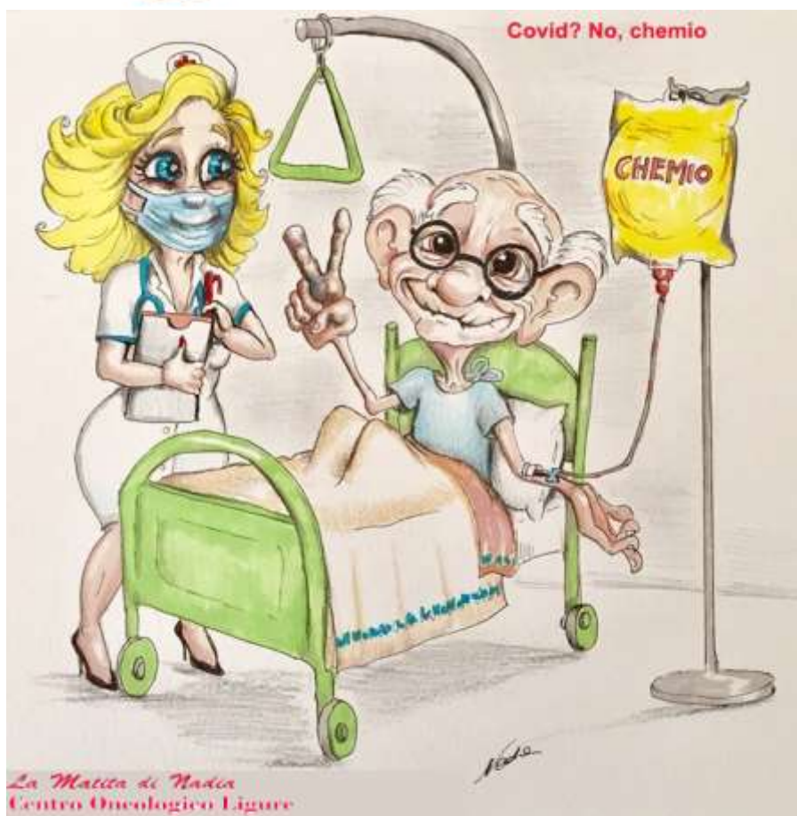
La Mattina di Nadia Centro Oncologico Ligure

quale porta devono bussare (a pieno diritto) tutti questi genovesi? Per quanto riguarda il SSN la risposta è, in questo caso, piuttosto imbarazzante. Per quanto riguarda il CoL, invece, nessun imbarazzo: la nostra porta è sempre aperta, riceviamo telefonate senza problemi (di persona si viene per forza solo per le visite prenotate), gran parte delle specialità sono attive e basta prenotarle. Ecco, potendo, in questa Newsletter, di Covid vorremmo parlare il meno possibile (già ci pensano telegiornali e social media a martellarci con news non sempre essenziali e utili), preferendo parlare di voi e di noi: il diritto alla salute non può (di nuovo!) venire dopo, essere ancora sacrificato (per imprevidenza e incapacità) ad altre cose, per quanto importanti. Ognuno faccia la sua parte, insomma. Noi – fin che ce lo faranno fare e sempre in piena sicurezza- facciamo la nostra.