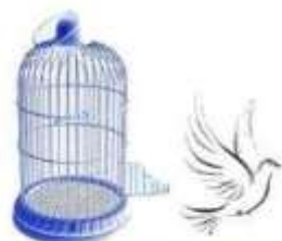
Gli Amici di Zaccheo

Per informazioni potete contattarmi: Enrico 370 1313473