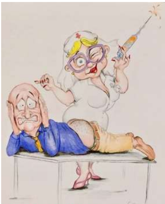
La Matita di Nadia (CoL - Centro Oncologico Ligure)

si sa, ogni mese è buono per sperimentare a tavola qualcosa di saporito e, naturalmente, di salutare. Insomma, conviene pensarci e provarci. A proposito: se anche il volontariato – per dirla tutta - può essere un bell'esperimento, in ambulatorio o in infermeria, perché, cari lettori, non provate al CoL?