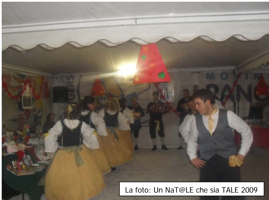
La foto: Un NaT@LE che sia TALE 2009