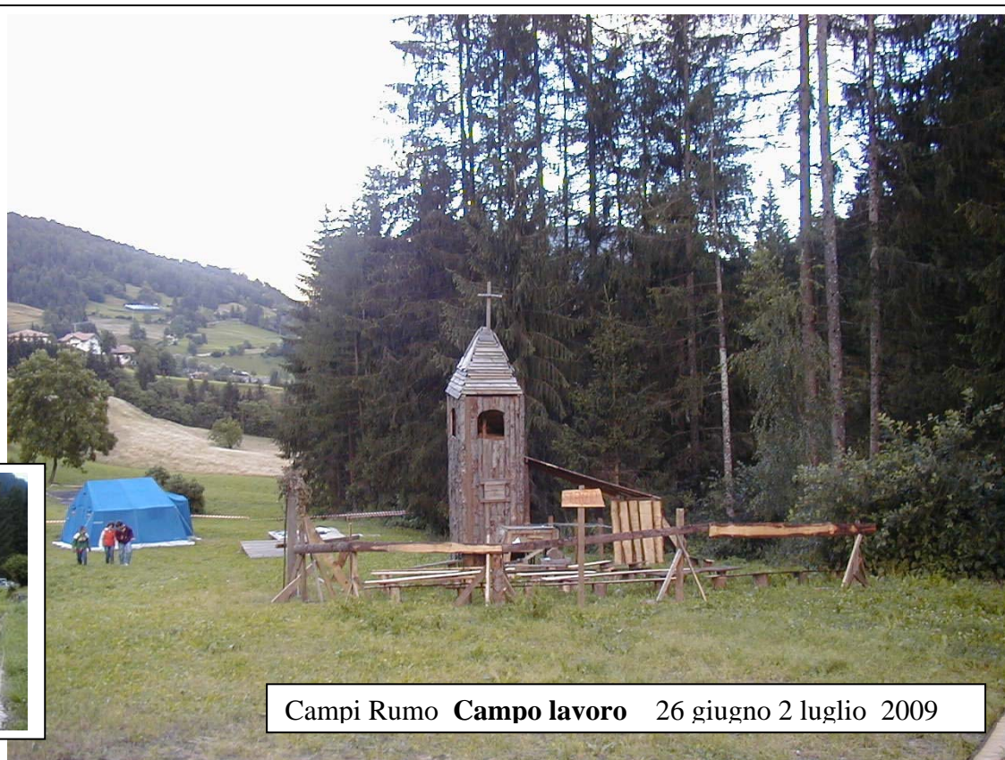
Campi Rumo Campo lavoro 26 giugno 2 luglio 2009

A pagina 4 il “Ci mancava” ci ricorda tutte le iniziative, di tutti i gruppi fino alla fine di Agosto. Tutte importanti. Per noi della Madonnetta il 23 e 24 maggio è una data da segnare subito sul calendario che abbiamo in cucina! Alcuni sono già mobilitati altri si aggiungeranno. Rangers e Millemani Madonnetta in collaborazione con tutte le altre realtà di S. Nicola e della Madonnetta: tutti insieme per una festa: “Questa è la mia casa”. Prima il campo di Primavera a Collegno 1-2-3 maggio. Ieri, giovedì 23, sono stato alla Madonna dei Poveri e ho sentito l’ansia e l’attesa da parte del GRMP e di insiemeXcon: per questi tre giorni in Borgata Paradiso. E’ un regalo ai ragazzi di Collegno come lo è stato per gli spoletini la partecipazione al convegno il 28-29 marzo. La foto del Prato a Rumo ci vuole ricordare i campi estivi tutti programmati e anche il desiderio sempre se siamo tutti d’accordo, di acquistare anche il prato sotto, quello della “fossa” o meglio “grasa” per poter stare tutti con tende e struttura e vari servizi sul nostro territorio. Girando per i gruppi noto anche qualche difficoltà a motivare i più grandicelli. Anche per chi abbandona il gruppo per vari motivi cerchiamo di lasciarne sempre una porta aperta. “Mentre era ancora lontano, suo padre lo vide e ne ebbe compassione. Gli corse incontro, gli si gettò al collo e lo baciò” Lc 15,20