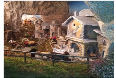
Dettaglio presepe in chiesa.

picamente italiano ricco di abitazioni, fiumi, pastori, animali e quant'altro tipico di una scena bucolica si stagliava la grotta della natività, probabilmente vestita in maniera non conforme al vero per via della ricchezza degli abiti, ma comunque molto belli, dovuti ad autori della scuola del Maragliano, lo stesso della Madonnetta. Successivamente ci siamo spostati nel vicino convento della "Famiglia Religiosa del Verbo Incarnato" dove un gruppo di suore molto simpatiche ci ha riservato un'accoglienza con i fiocchi, dapprima in chiesa dove dopo aver ammirato il loro presepio, anch'esso grande e curato nei minimo dettagli, ci ha intrattenuto raccontandoci la storia dell'Ordine, la diffusione nel mondo, il perché della loro presenza a Genova dato che sono Argentine, prestandosi anche a dare risposta sul loro stile di vita. Dopo una preghiera recitata assieme ci siamo spostati in un locale