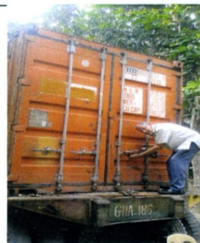
Padre Luigi apre il 23° container arrivato nella missione di Cebu City ad aprile 2019!