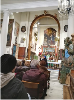
Mosaico in ascolto!

ricordare la nascita di Gesù è nata a Greccio da un'idea di San Francesco, ma poi questa si è diffusa, e qui da noi ha attecchito mettendo solide radici. C'è dire che trovare nel circondario quale visitare è una delle attività più semplici, trattandosi solo di decidere se andare a est o a ovest piuttosto che a nord (a sud non si può) e il gioco è fatto perché un presepe da visitare si trova sempre.