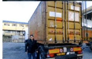
23° Container: direttamente dal Porto di Genova a Cebu City