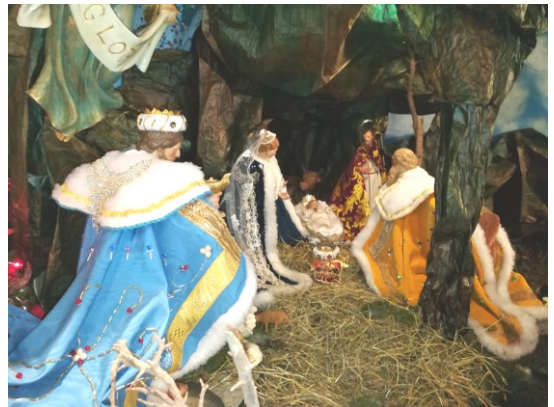
Natività presepe in Convento.