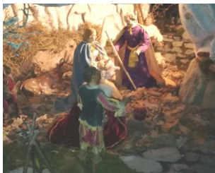
Dettaglio Natività presepe in chiesa.

Date le dimensioni dell'edificio siamo entrati un po' titubanti non riuscendo a capire dove potesse essere situato il presepe che internet