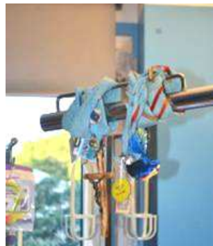
Il crocefisso assieme alle promesse sul letto.