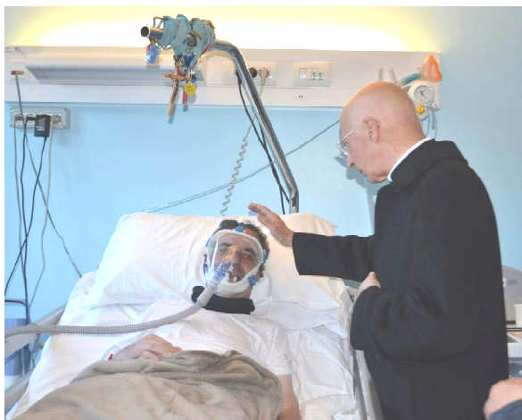
La benedizione del Cardinale Angelo Bagnasco!

mille gesti che mi fanno volare. Altra sorpresa sono stati i vari primari dei “tre”: Nemo, Hospice e Villa Scassi. Aggiungo San Martino, tutti in cordata per il mio caso. Mi fa sempre paura il gioco al massacro, sulla sanità perché