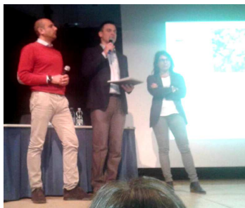
Un momento dell'incontro presso il teatro di Marcena.