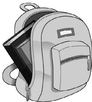
800 zainetti scuola per Bafut