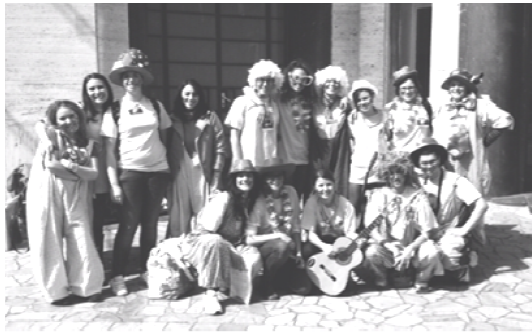
Porto dei piccoli Istituto G. Gaslini (Ge)

del Gaslini, abbiamo svolto attività, attraverso giochi e canzoncine, in tutti i reparti. Siamo stati divisi in piccoli gruppi capitanati da uno degli operatori delle associazioni ed ognuno di noi non ha dovuto far altro che essere se stesso e offrire ai bimbi il meglio di sé.