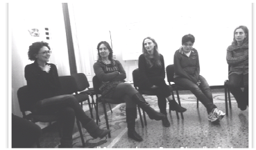
Campo base "Don Piero"

contato la loro esperienza, poi una riflessione sulla struttura delle riunioni settimanali dei bambini e dei ragazzi con occasione di dibattito e condivisione di nuove idee