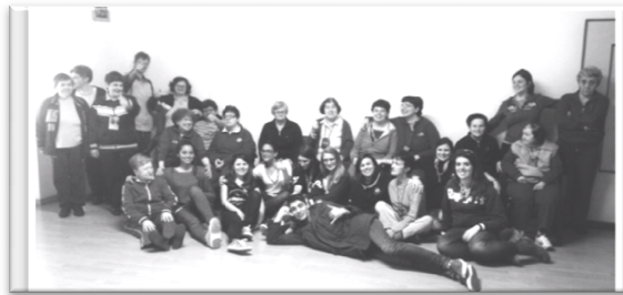
Opera Giosuè Signori

gers abbiamo fatto animazione pomeridiana con balli di gruppo, giochi e un laboratorio in cui abbiamo costruito braccialetti. L'emo-