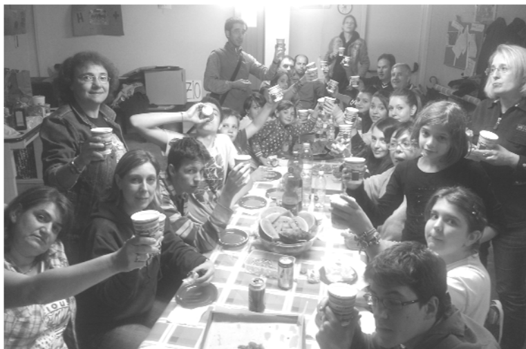
InSieme X Con: e i ragazzi Rangers GRMP e non siamo tutti qui.