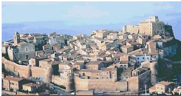
ISOLA DEL GIGLIO – Giglio Castello