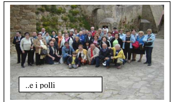
..e i polli