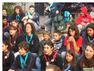
Un gruppo di ranger