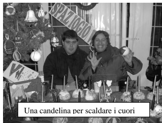
Una candelina per scaldare i cuori