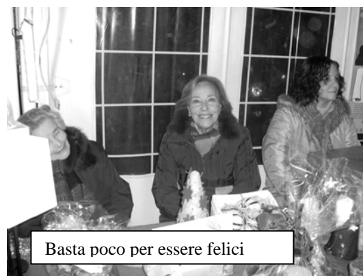
Basta poco per essere felici