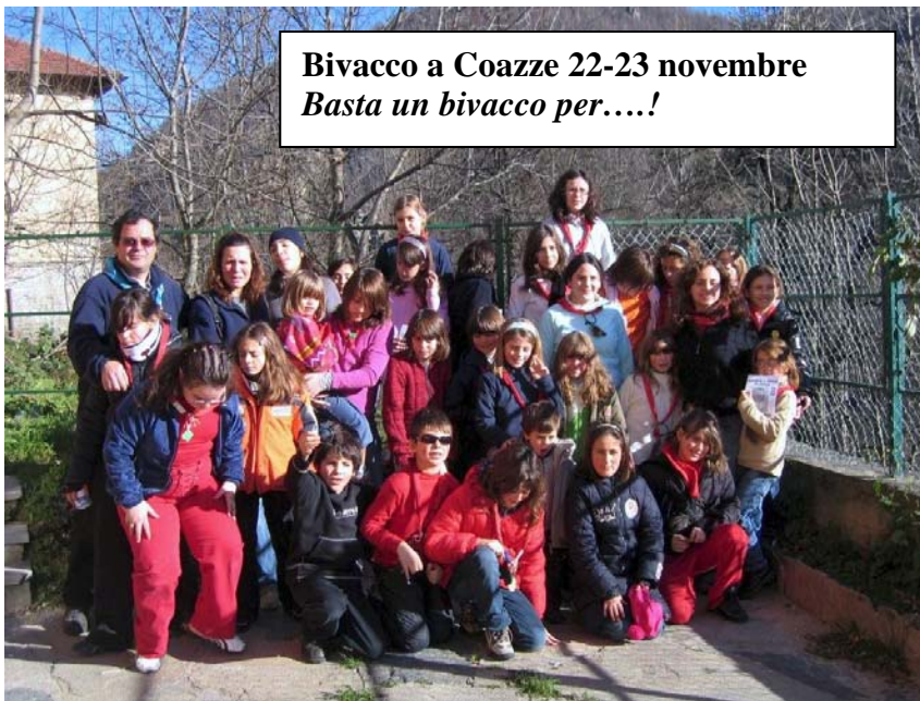
Bivacco a Coazze 22-23 novembre Basta un bivacco per....!