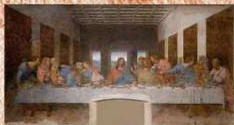
Cenacolo - Convento Santa Maria delle Grazie, Milano