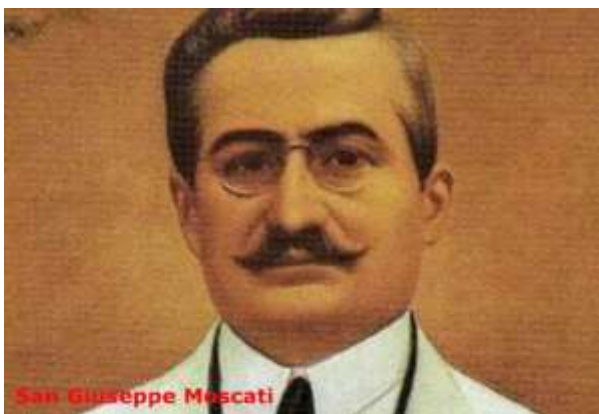
San Giuseppe Moscati

P er prenotarsi alle visite e al pranzo di solidarietà telefonare al numero 333.6879636.