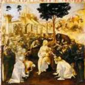
Adorazione dei Magi - Uffizi