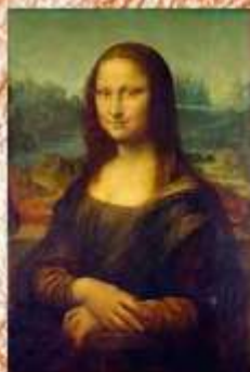
La Gioconda - Louvre