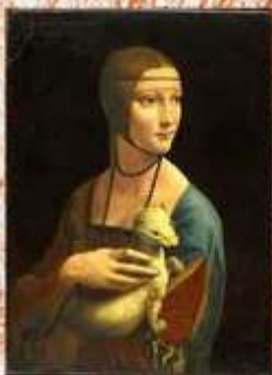
Ritratto di Cecilia Gallerani Museo Nazionale di Cracovia