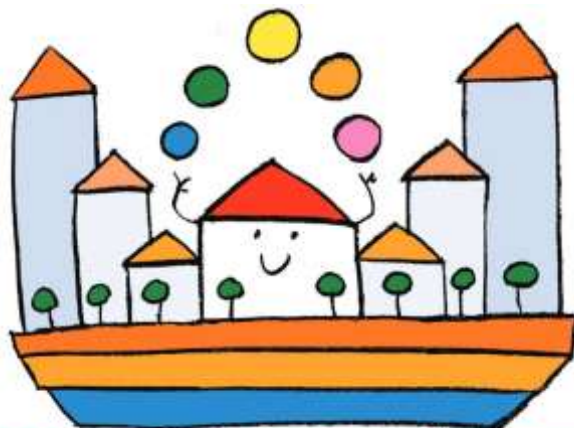
ALLEANZA SINDACI E GIOVANISSIMI PER COSTRUIRE CITTÀ AMICHE DELLE BAMBINE E DEI BAMBINI

"Dai, vediamo in tanti.....non inquina neppure", potrebbe essere lo slogan che invita a partecipare in molti!