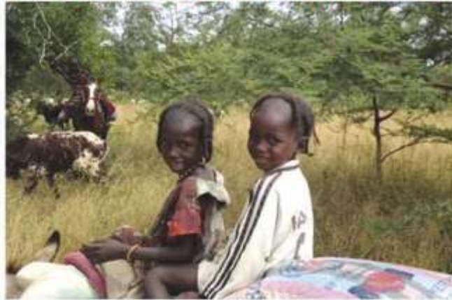
Transumanza nel Sahel, foto: Elena Dak