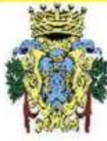
Comune di Rapallo