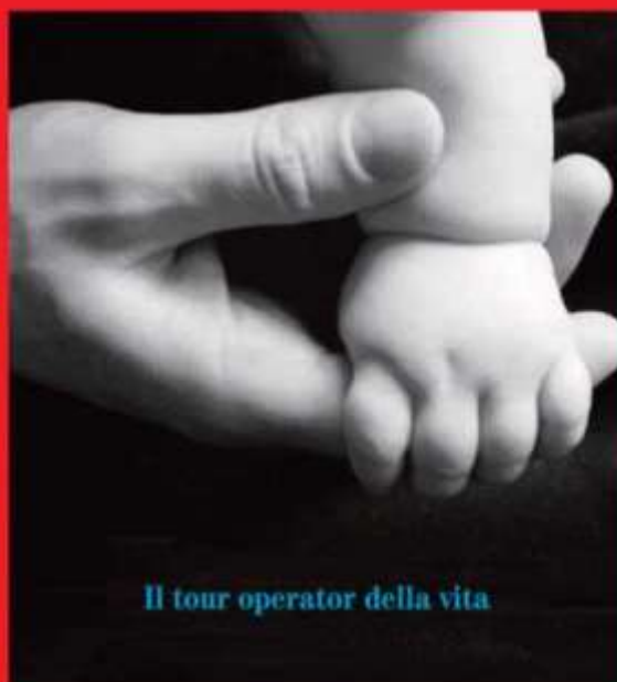
Il tour operator della vita

regala un abbonamento a prezzo ridotto per il Teatro Stabile e dona una serata alla Fondazione Flying Angels Onlus